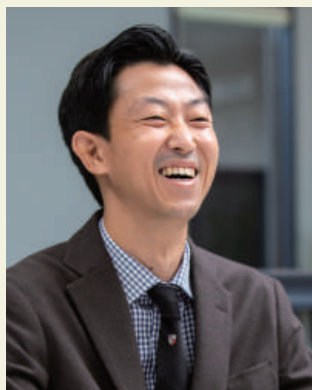
あきら 東京 林 陽

クリニックの設計施工に 特化していることを強みに、 医療について幅広く理解し、 提案できる存在でありたい。